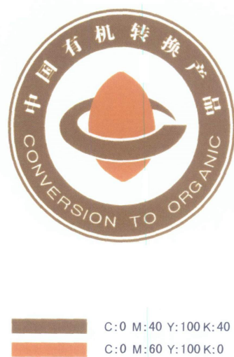
图 2 中国有机转换产品认证标志