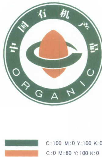
图 1 中国有机产品认证标志

7.1 中国有机产品认证标志和中国有机转换产品认证标志的图形与颜色要求如图 1、图 2 所示。